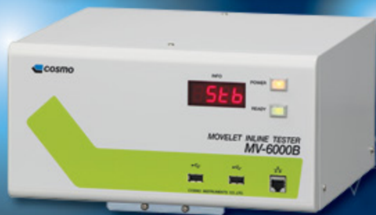
ムーブレットインラインテスター MV-6000B