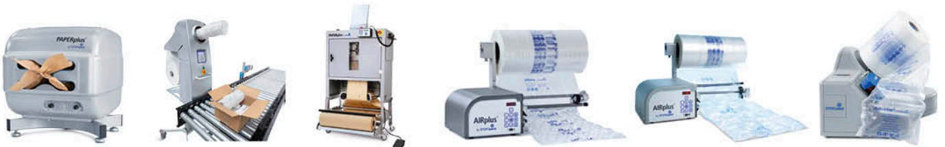
機械は無料レンタル。資材のみの購入で使用できる